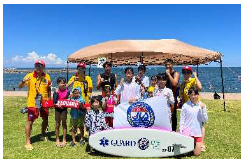
練習会の様子 (NPO法人 TEAM AVANTE)

⚠️ 必ず、事前に、市民協働相談課へご相談いただき応募要件や必要事項を確認してください。