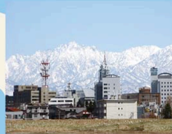
対岸に見える市街のビル