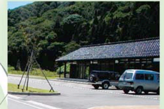
化石資料館「海韻館」 八尾地域の歴史を伝える貴重な化石を保存し、 学び・体験できる施設です。