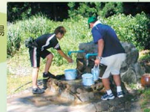
ガット水 知る人ぞ知る「ガット水」 水汲みの人が絶えません。