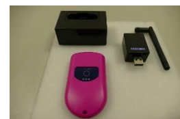
モーションセンサー