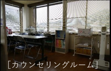
[カウンセリングルーム]