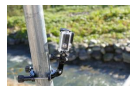
ウェアラブルカメラ