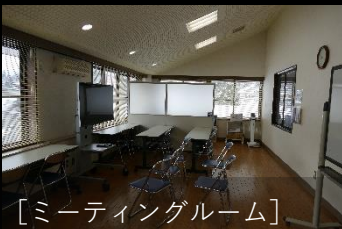
[ミーティングルーム]