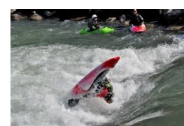
フリースタイルカヌー