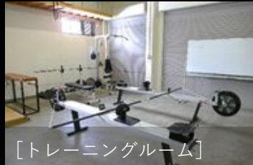
[トレーニングルーム]