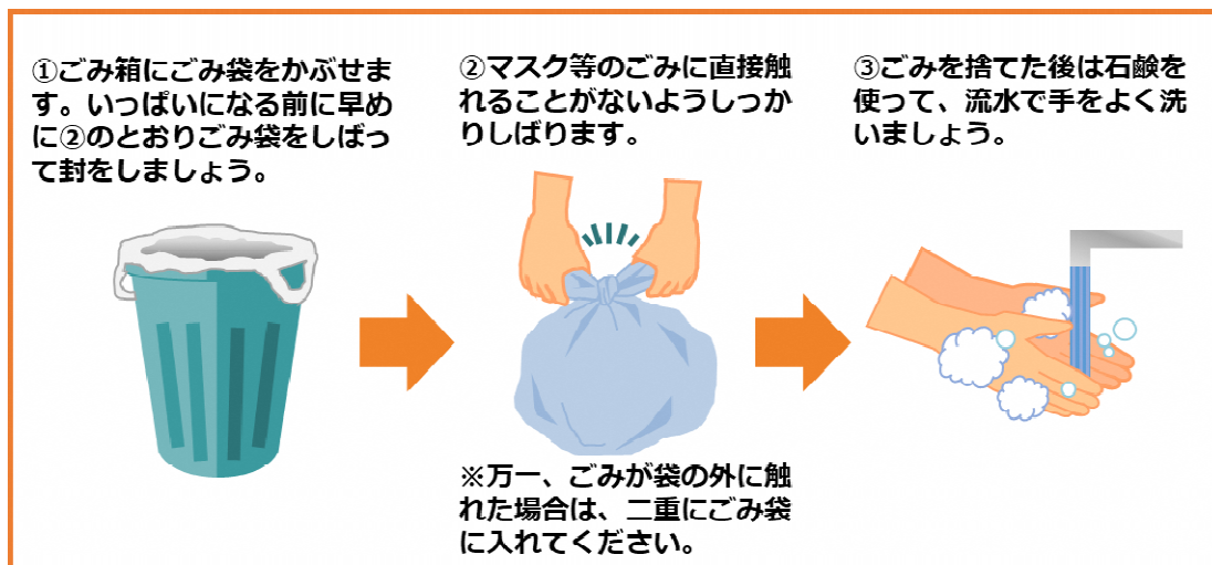
図1 新型コロナウイルス等の感染症の感染者又はその疑いのある方の 使用済みマスク等の捨て方(環境省)