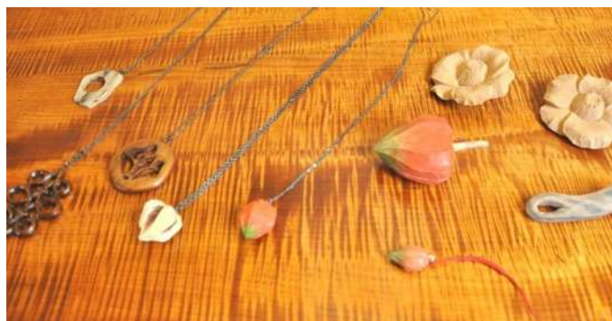
アクセサリー（ブローチ、ペンダントほか）