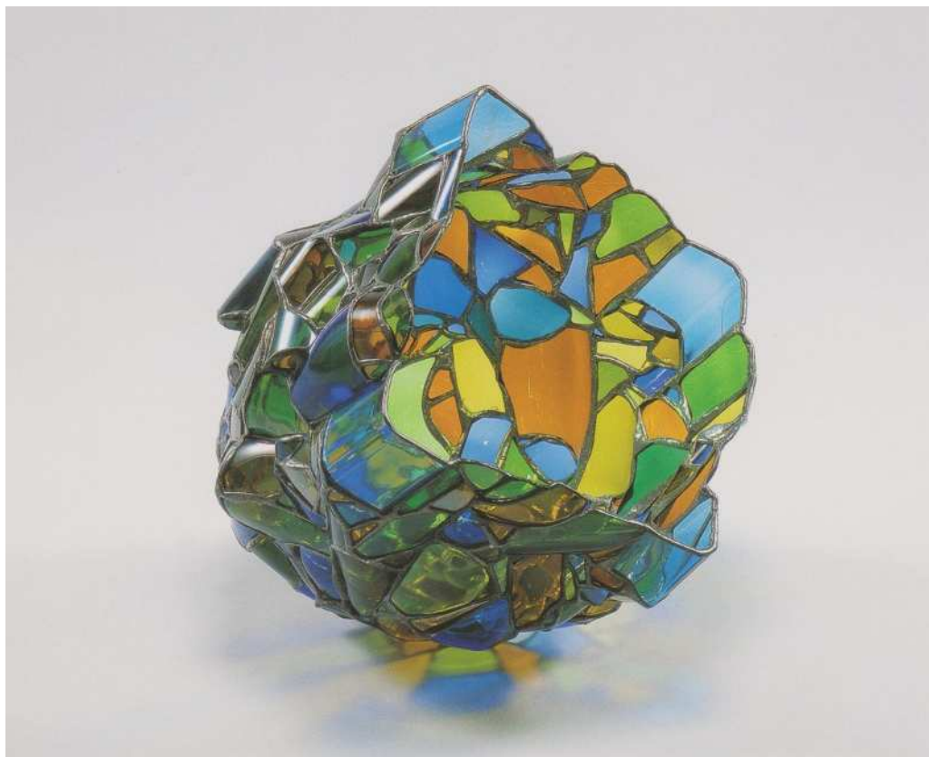
ステンドグラス 「共鳴 誕生」

経歴 富山県展 入選13回 日本現代工芸美術展 入選15回 第52回日本現代工芸美術展 現代工芸賞受賞 日展 入選4回