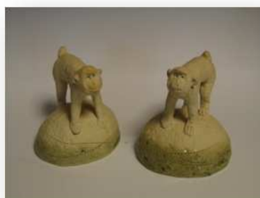
陶作品「お山の大将」