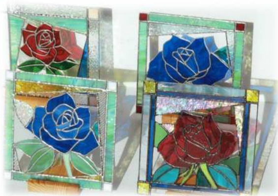
ミニパネル「青バラ」「赤バラ」縦18cm 横18cm 各10,000円