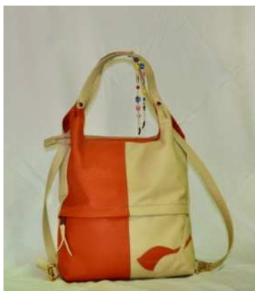
肩からショルダー兼リュック サック(牛革)