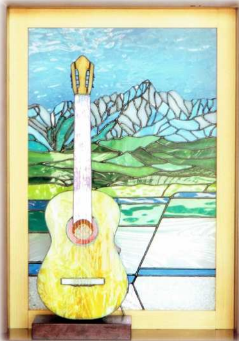
ステンドグラスパネル 「窓辺のギター」