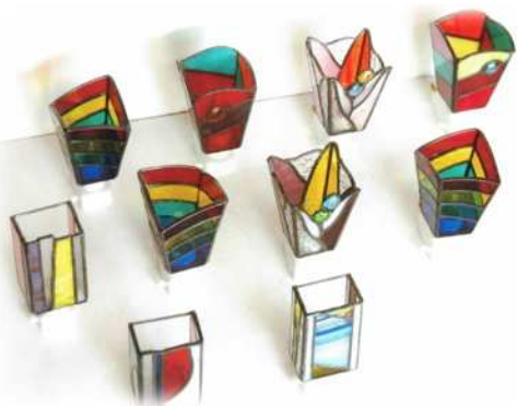
お休みランプ 各3,500円