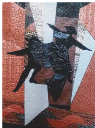
革ぞお〜がん「おわら」