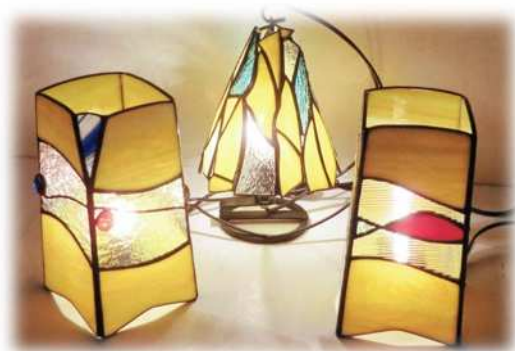
テーブルランプ 13,000円～23,000円