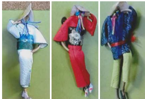
革ブローチ「おわら」