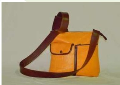
ショルダーバッグ(鹿の革と牛革)