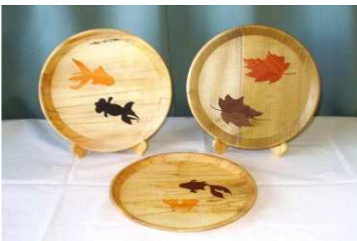
木象嵌木皿「金魚」、「木の葉」 直径21cm