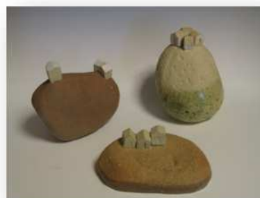
陶作品「小さな町シリーズ」

陶土(信楽土)で造形し、乾燥後、素焼き。施釉のあとに本焼きをして、仕上げる。明日への想いを若い女性の半身像で表現している。 高さ30cm