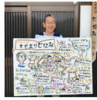
インフォグラフィック

話を聞くだけのトークイベントから、話を聞いて見るトークイベントにできます。そこから、グラフィックを活用して参加者を巻き込んでいくことが可能です。