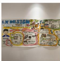
企業周年イベント

ワールドカフェなどのワークショップとグラフィックのコラボも可能です。参加者の声を拾ったり、グラフィックを活用して新たな気づき・考えを深めることが可能です。