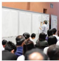
シンポジウム・セミナー

社内の会議をグラフィックで見える化します。グラフィックを活用して、会議の活性化・想いの共有などを行います。グラフィックでお互いの発言を認識しながら、進めていけるので、会議が空中戦になることを防ぐことができます。