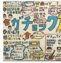
グラフィック看板

会社や事業への想いを、グラフィック化致します。ホームページや求人情報などにも掲載可能です。