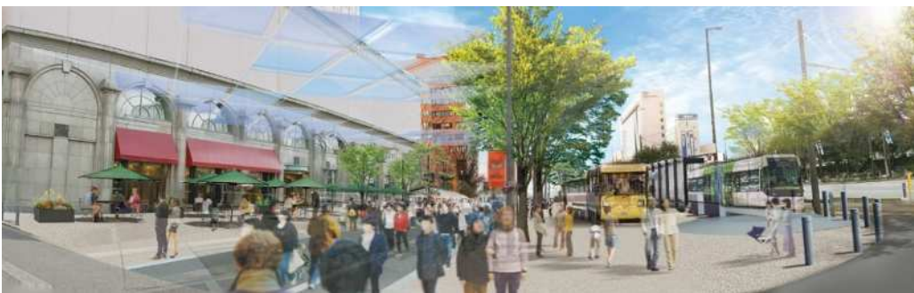
R5年度実施内容:本工事、社会実験等