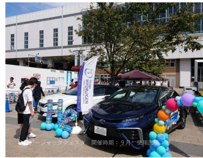
カージャックフェスタ 開催時期：9月 使用面積：㎡