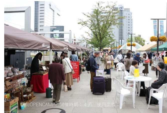
駅前OPENCAMP 開催時期：4月 使用面積：㎡