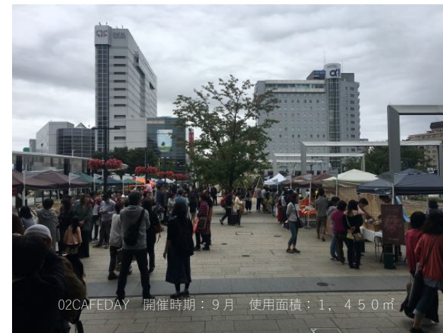
O2CAFEDAY 開催時期：9月 使用面積：1,450㎡