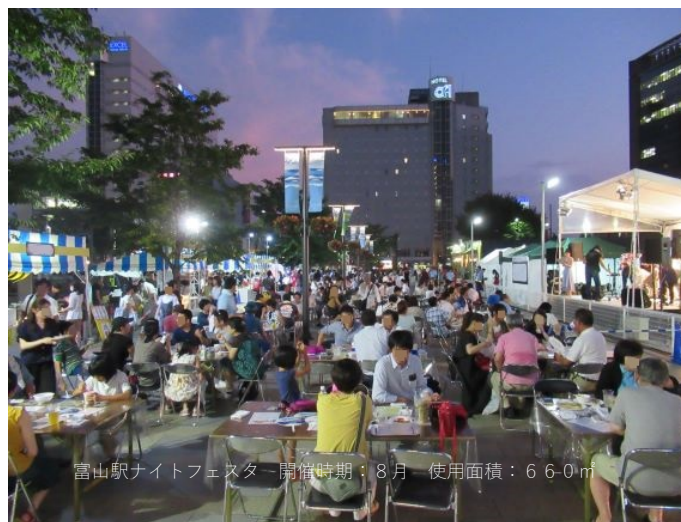
富山駅ナイトフェスタ 開催時期：8月 使用面積：660㎡