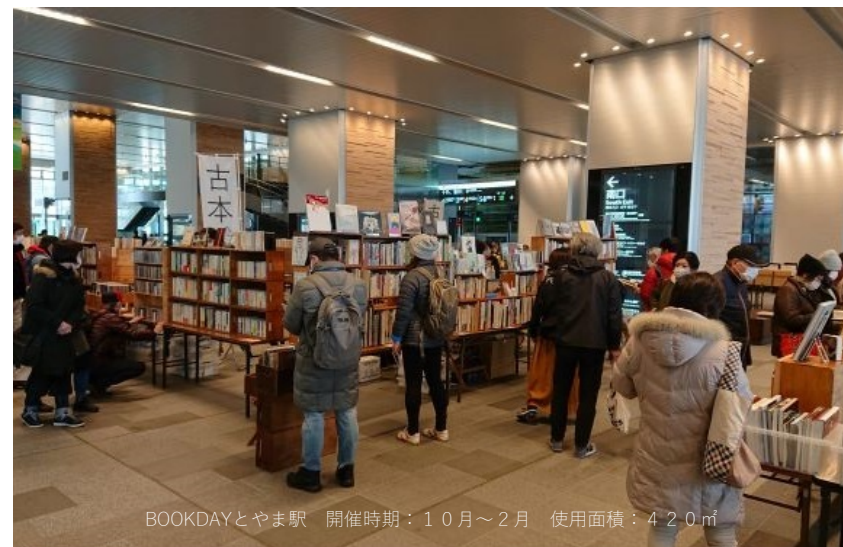
BOOKDAYとやま駅 開催時期：10月～2月 使用面積：420㎡