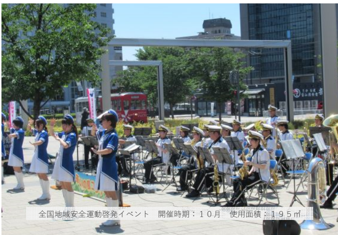
全国地域安全運動啓発イベント 開催時期：10月 使用面積：195㎡