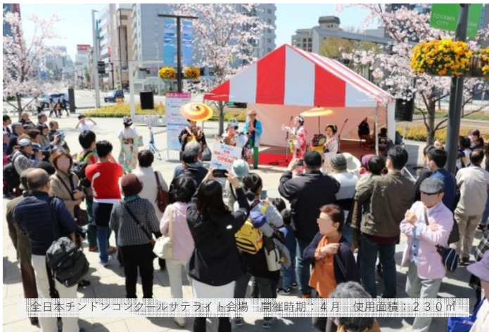
全日本チンドンコンパルサテライト会場 開催時期：4月 使用面積：230㎡