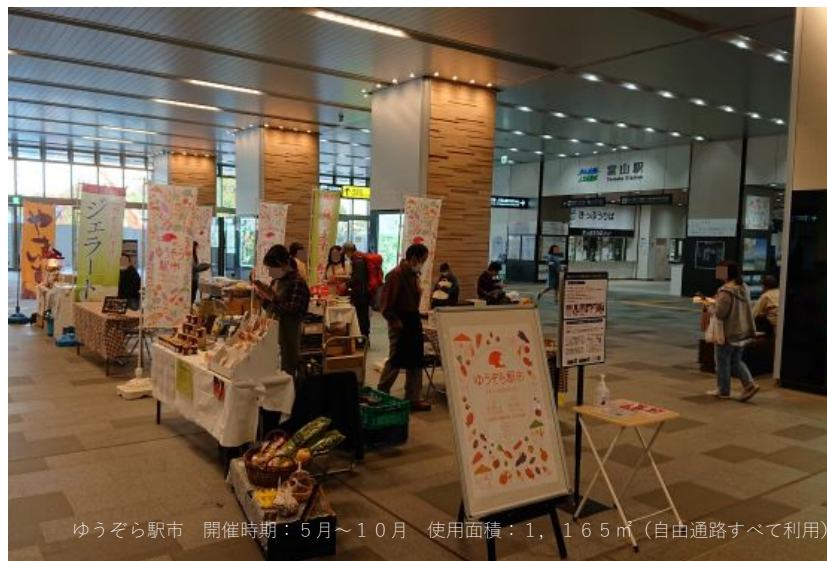
ゆうぞら駅 開催時期：5月～10月 使用面積：1,165㎡（自由通路すべて利用）