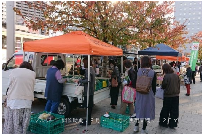
とやマルシェ 開催時期：9月～11月 使用面積：420㎡