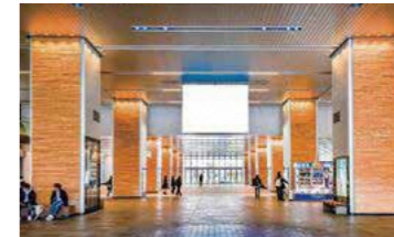
南口から見た(手前から)B、A