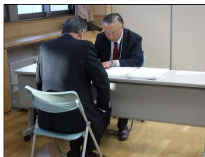
昨年度の開催の様子