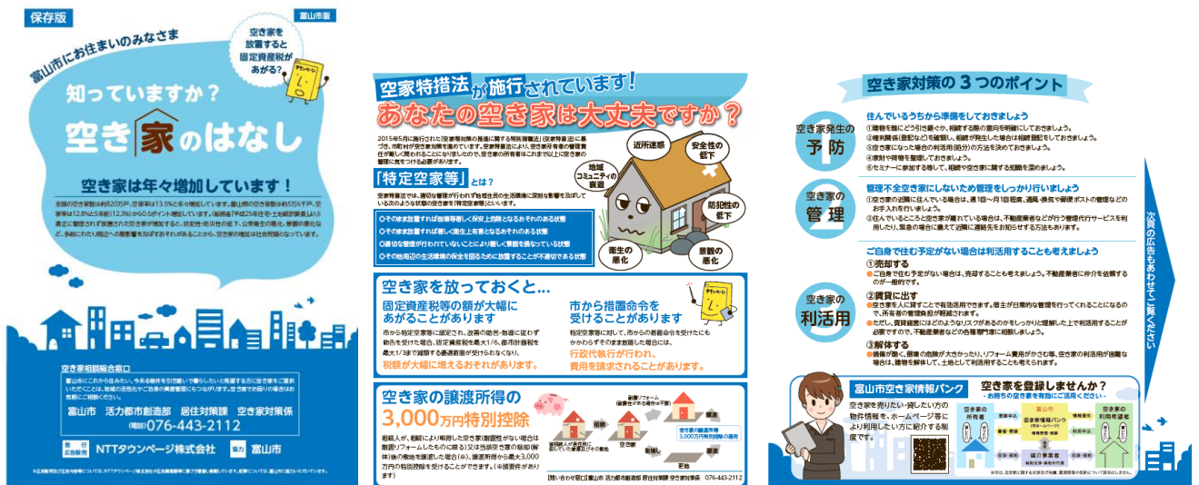
NTTのタウンページに同封したパンフレット

また、新たな取り組みとして、空き家に関する啓発パンフレットを富山市内の家庭に配布する N T T のタウンページに同封する取り組みも行っています。