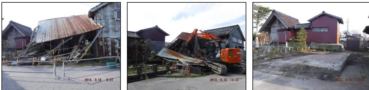
(参考) 平成 30 年度における措置の様子 (略式代執行)

特定空家等の該当判断や講ずべき措置について専門的な知見を踏まえて、助言・指導など、「空家等対策の推進に関する特別措置法」に基づく対処を適切に進めていきます。