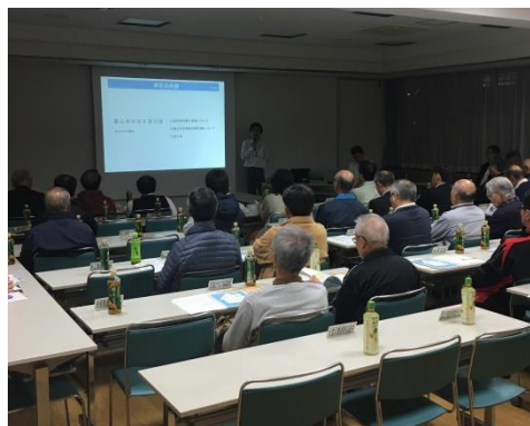
地区センターでの出前講座