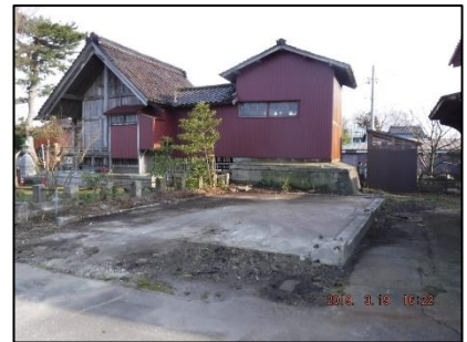
H31. 3. 17 に施行した略式代執行の様子（水橋地区）