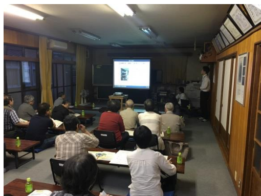
公民館での出前講座

本市では、平成29年度から市役所出前講座に空き家対策についてのメニューを追加しました。平成30年度には4町内会から申し込みがあり、参加した住民の方からは「所有者不明の空き家に対する取り組みを進めて欲しい」との意見や、「町内会としてどのように取り組めば良いのかなど、空き家問題意識に対する関心の高さがうかがえました。令和元年度も引き続き出前講座を実施していきます。