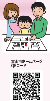
「QRコード」は株式会社デンソーウェブの登録商標です。