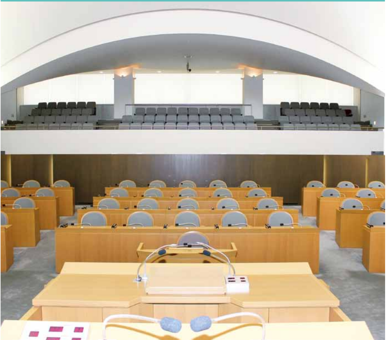
議長席から見た議場