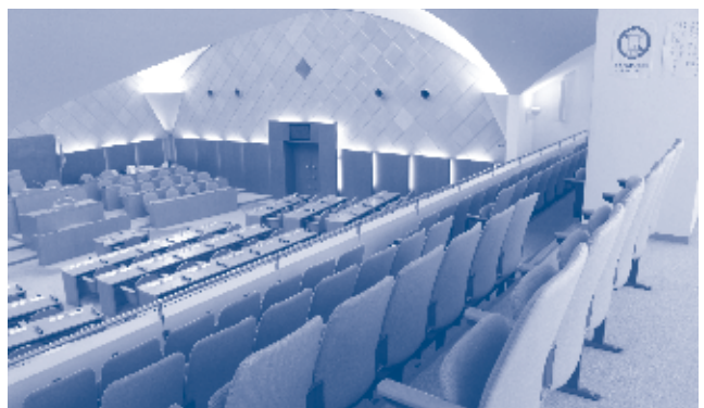
市役所東館8階にある傍聴席