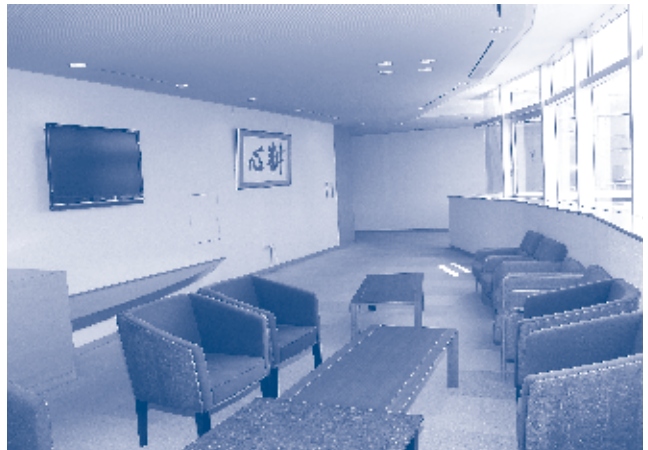
市役所8階東側展望ロビーに設置されたテレビ