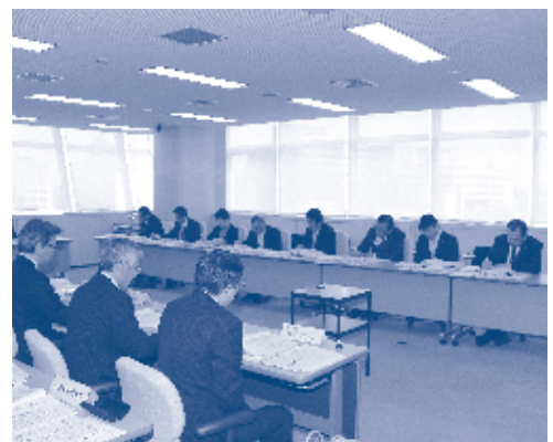
委員会の様子 (平成29年3月定例会)

委員会には、常に設置されている「常任委員会」、必要に応じて特定の事項を調査するために設置される「特別委員会」、議会の運営が円滑に行われるよう、議事の順序や進め方などを協議する「議会運営委員会」があります。