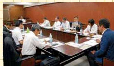
仙台市での視察の様子

【盛岡市】北海道新幹線開業による観光交流事業 盛岡ブランド推進計画 【仙台市】農商工連携・6次産業支援