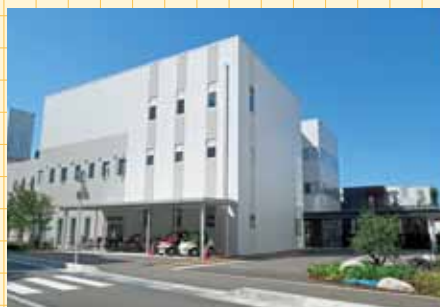
まちなか総合ケアセンター

みなさんこんにちは、市立探偵ベロリッヂです！ 私は、今回、富山市議会の活動を調べにきたよ！ わんわん！