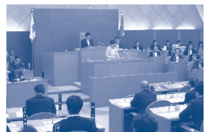
委員長報告の様子