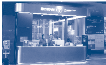
富山駅総合案内所

市 本事業費の内訳は、主に人件費であり、常時3名の職員を配置する予定である。また、韓国語への対応については、県と検討中である。