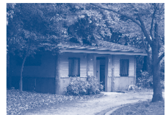
更新が決まった稲荷公園トイレ