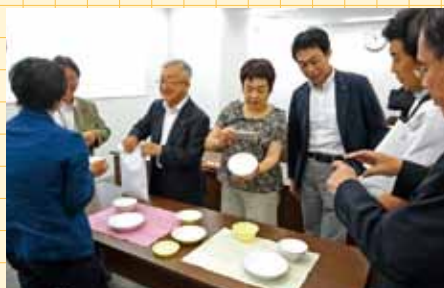
草加市での視察の様子

【荒川区】タブレット端末を活用した学校教育 【墨田区】すみだ北斎美術館の管理運営