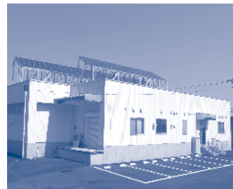
牛岳温泉植物工場

▼農業 ▼環境関連 ▼呉羽南部企業団地の進捗状況等 ▼中心地における自転車利用の推進