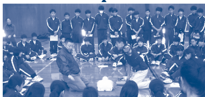
AEDを使った救命講習の様子