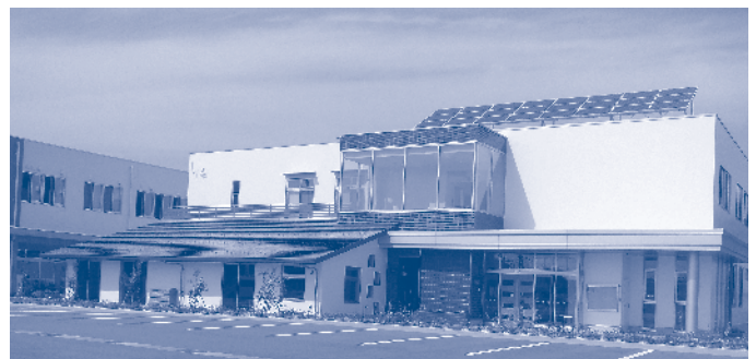
移転改築した豊田公民館