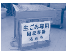
生ごみ専用回収容器

答 これまでも住民の皆さんのさまざまなご意見により、①コンパクトなサイズへの変更②金属の使用によるフレームの補強③マジックテープの追加による開閉部の強化—など、改良を重ねてきている。今後も使いやすく、カラス等によるごみ散乱被害の防止を図っていくため、さらなる改良に加え、新たな容器の選定についても情報収集に努めていきたい。（環境部長）