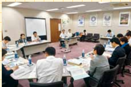
横浜市での視察の様子

【郡山市】ベップキッズこおりやま 【横浜市】横浜市立市民病院再整備事業 【青梅市】公共施設マネジメントの取り組み 【浦安市】妊娠から子育て期までの切れ目のない事業