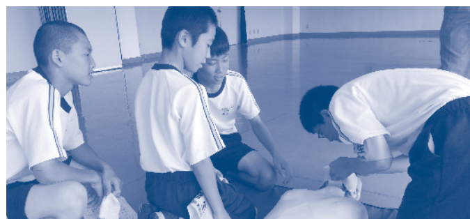
社会に学ぶ14歳の挑戦での救命講習の様子