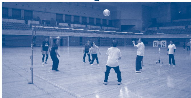
スポーツクラブのプログラムで楽しく健康・体力づくり

▼スポーツレクリエーション活動の振興 ▼子どもたちのスポーツに対する取り組み ▼成人の生涯スポーツに対する取り組み ▼高齢者のスポーツ環境