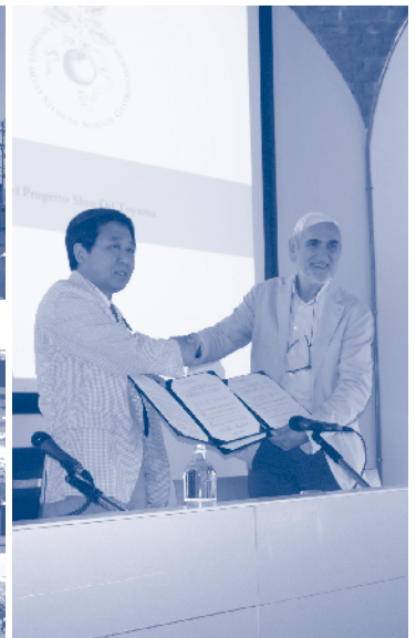
協定を締結する森富山市長（左）とイタリア食科学大学副学長（右）