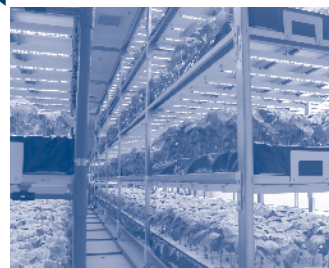
エゴマが栽培されている様子