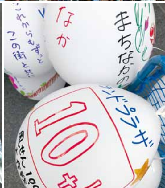
10周年を迎えた「グランドプラザ」