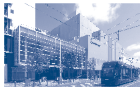
まちなかを走るセントラム