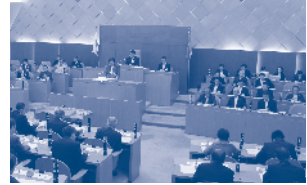
市長の提案理由説明の様子

※録画中継は、各本会議終了後、おおむね4日後（土・日および祝日を除く。）からご覧いただけます。