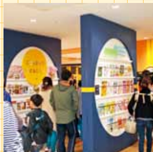
とやまこどもプラザ