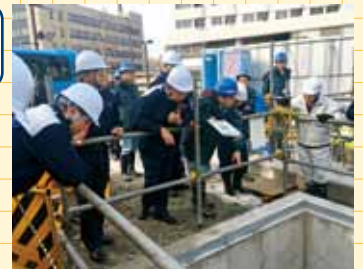
松川雨水貯留施設での視察の様子