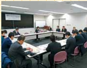
きぼう保育園についての視察の様子