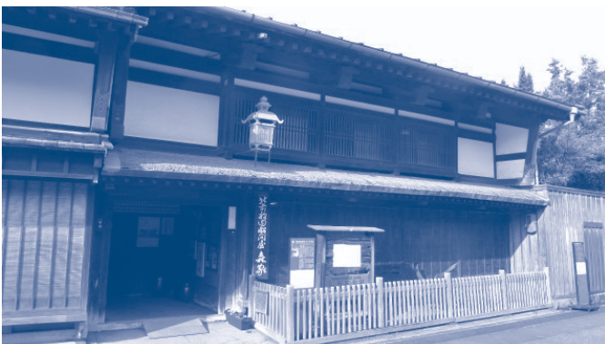
日本遺産「北前船」の文化財として追加認定された旧森家住宅