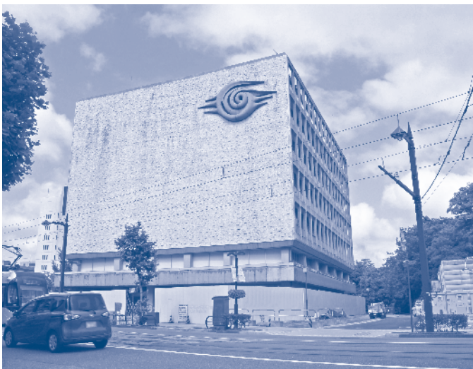
解体される図書館旧本館