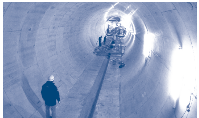
完成した松川雨水貯留施設