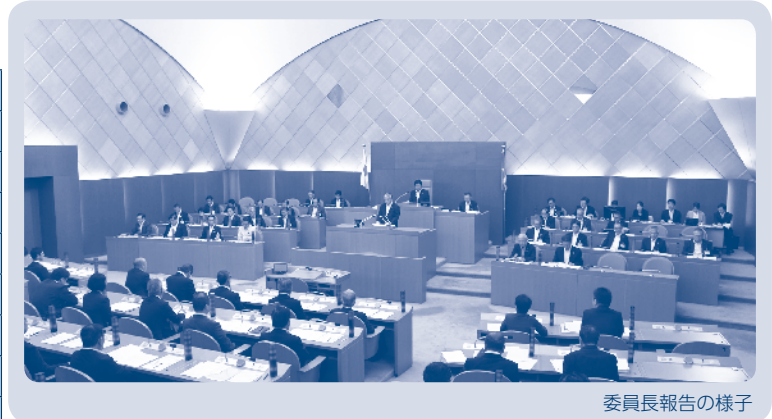
委員長報告の様子