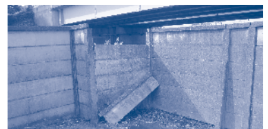
撤去される市所有のブロック塀等