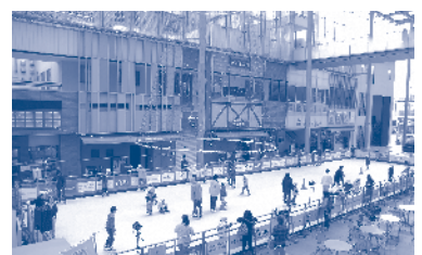
新たな樹脂リンクで実施される予定のエコリンク(グランドプラザ)