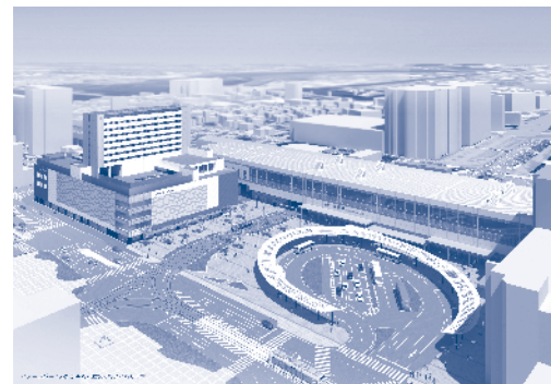
富山駅南西街区 市有地活用事業 提案施設 (左側。完成イメージ鳥瞰図)