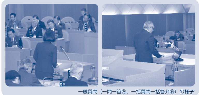
一般質問 (一問一答④、一括質問一括答弁⑤)の様子