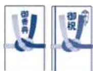
葬式、結婚式での代理出席者からの香典、祝金