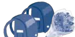
葬儀の花輪、病氣見舞い、入学祝、卒業祝