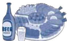
お祭りや運動会への寄附、差し入れ