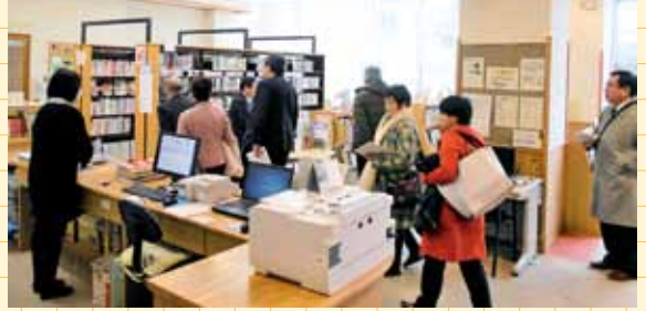
山田小学校・中学校での視察の様子

富山市で実施している小中一貫的連携教育について、具体的な取り組みの内容を確認するとともに、義務教育学校への移行の可能性という観点から視察を行いました。（山田小学校・中学校、芝園小学校・中学校）