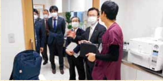
富山市まちなか診療所での視察の様子

在宅医療を推進する富山市まちなか診療所と、本年4月から富山まちなか病院となる富山通信病院を視察し、本市病院事業の今後の在り方について調査を行いました。