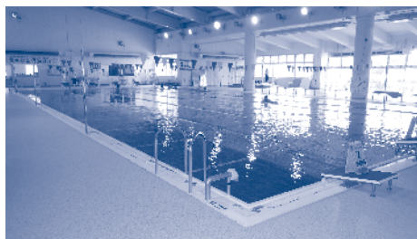
改修および多目的ホールの増築が予定される八尾B&G海洋センタープール

さらに、難易度の高い設計業務委託について、経験豊富な技術レベルの高い業者を選定する仕組みを確立するため、実績や技術者の資格要件の定め方などについても研究している。これらにより、再発防止に努めていきたい。