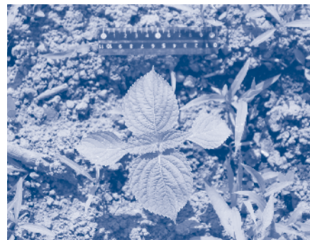
エゴマと雑草の写真（株間除草ロボット調査研究事業）

市 今回の更新で、汚水槽の中に設備を設置する水中式から、汚水槽の外に設置する陸上式に仕様変更することにより、修理やメンテナンスが容易になり、費用の低減が図られる。