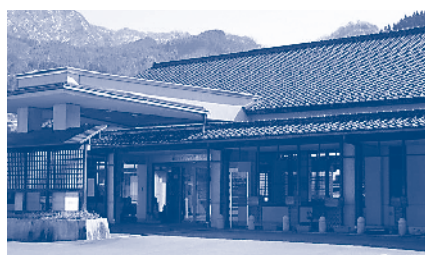
富山市細入デイサービスセンターが設置されている、富山市細入総合福祉センター外観

高齢社会における交通と健康モニタリング調査分析結果 中心市街地活性化基本計画の進捗