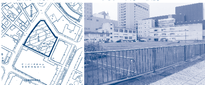
中規模ホール施設整備予定地（富山市芸術文化ホール北側市有地）

土地の有効活用ができるような整備位置であるとか、オーバーード・ホールと中規模ホールの両方がうまく利用できるように接続の方法については、今後、十分に検討してほしい。