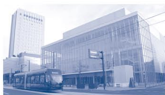
大規模改修が予定される富山国際会議場