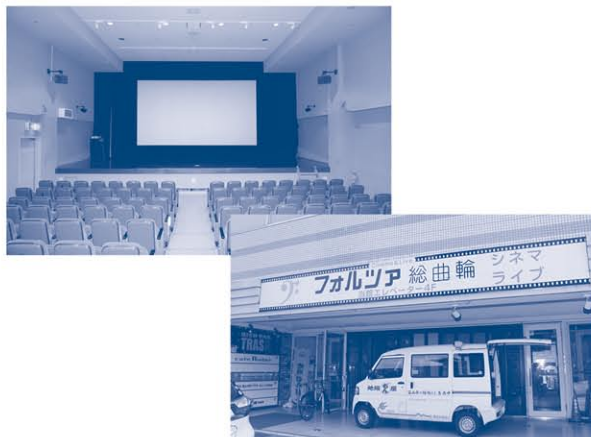
富山駅路面電車南北接続事業の開業に合わせ、再開が決まった賑わい交流館（旧フォルツァ総曲輪）

賛成意見 給食調理業務の民間委託を、今までこのように進めてきて、その上で、さらに2校での導入が可能だとする教育委員会の判断を尊重して賛成する。