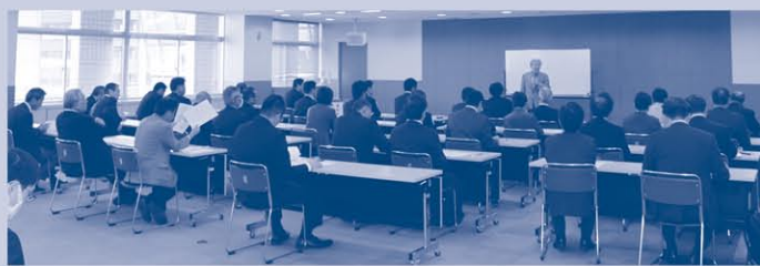
議員協議会の様子

議員政治倫理条例に関する検討を進めるため、11月12日に議員協議会を開催し、九州大学名誉教授 斎藤文男氏を講師に迎え、研修を行いました。