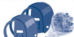
葬儀の花輪、病氣見舞い、 入学祝、卒業祝