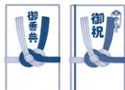
葬式、結婚式での代理出席者からの香典、祝金