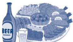
お祭りや運動会への寄附、差し入れ