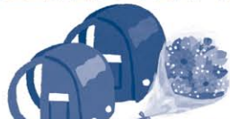
葬儀の花輪、病気見舞い、入学祝、卒業祝