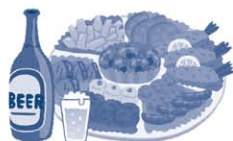
お祭りや運動会への寄附、差し入れ