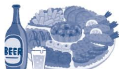
お祭りや運動会への寄附、差し入れ