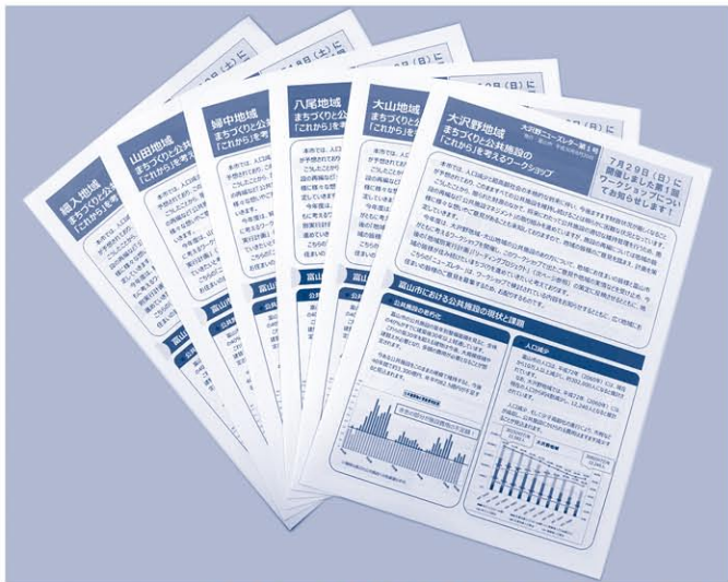
ワークショップでの議論の内容をまとめたニュースレター

【質問項目】 ▼新型コロナウイルス感染症ワクチン接種等 ▼まちづくりと公共施設の「これから」を考えるワークショップ