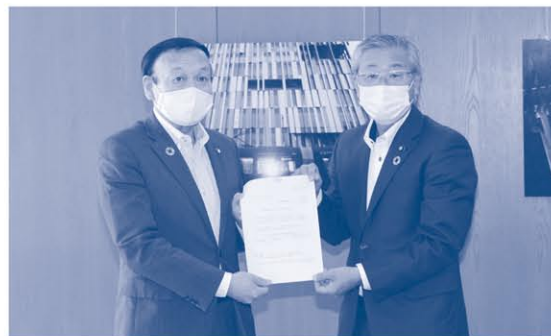
市当局への申し入れの様子

この決定を受けて、5月26日に、議長が市長に申し入れを行い、条例を改正するとともに、関連予算を減額補正し、減額分445万余円が新型コロナウイルス感染症対策基金に積み立てられることになりました。