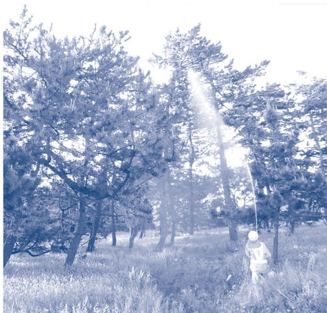
松くい虫対策として薬剤を散布する様子