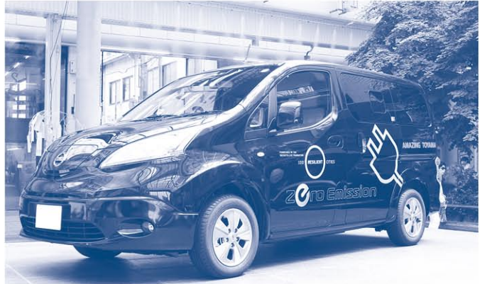
公用車として使用している電気自動車

※ゼロカーボンシティ…2050年の温室効果ガス排出実質ゼロを目指す都市。富山市は、本年3月に表明。