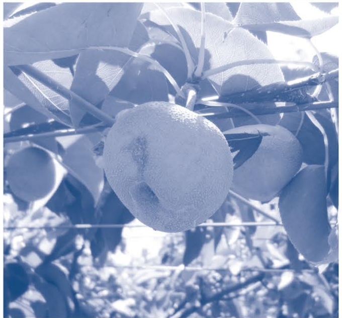
被害を受けた梨の様子