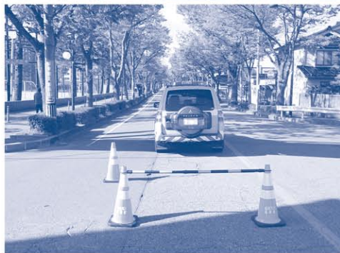
舗装補修を予定している道路（神通町蛭川線）（上） 現場確認中の様子（下）

正副議長および各委員会委員の構成につきましては、下記のURLまたは右のQRコードからアクセスして確認できます。