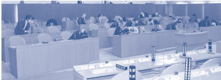
災害対応訓練の様子

大規模災害が発生した際に、迅速かつ適切な災害応急対策業務ができるよう、議員および議会事務局職員の役割等について確認を行い、防災意識の向上を図っていきます。