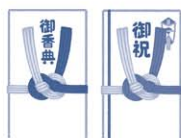
葬式、結婚式での代理出席者からの香典、祝金