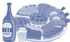
お祭りや運動会への寄附、差し入れ