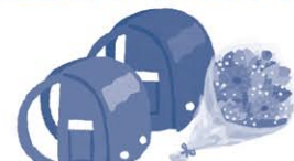
葬儀の花輪、病気見舞い、入学祝、卒業祝