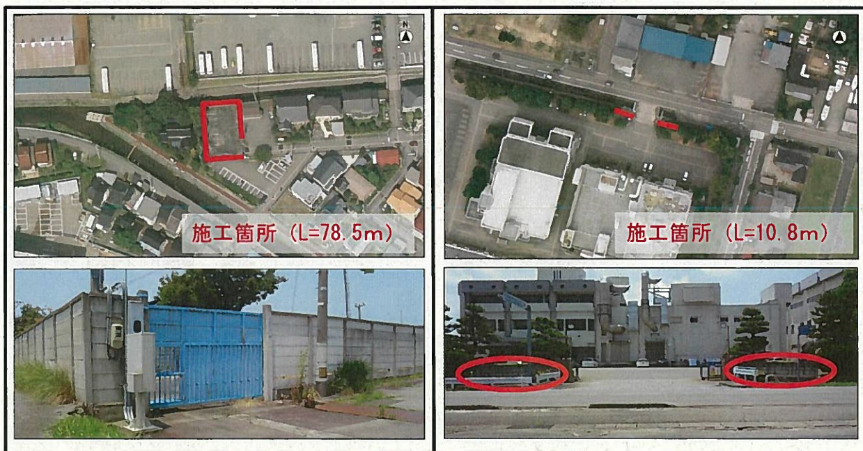
浜黒崎浄化センター (富山市 浜黒崎 地内)