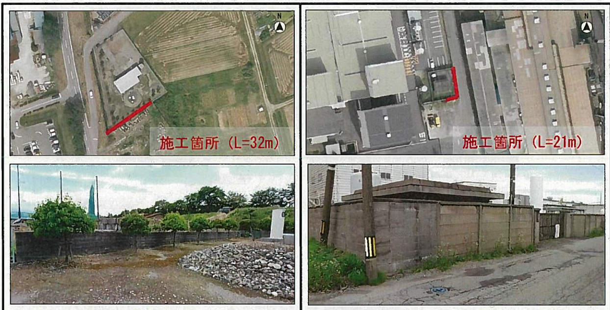
三井水源地（富山市高内地内）