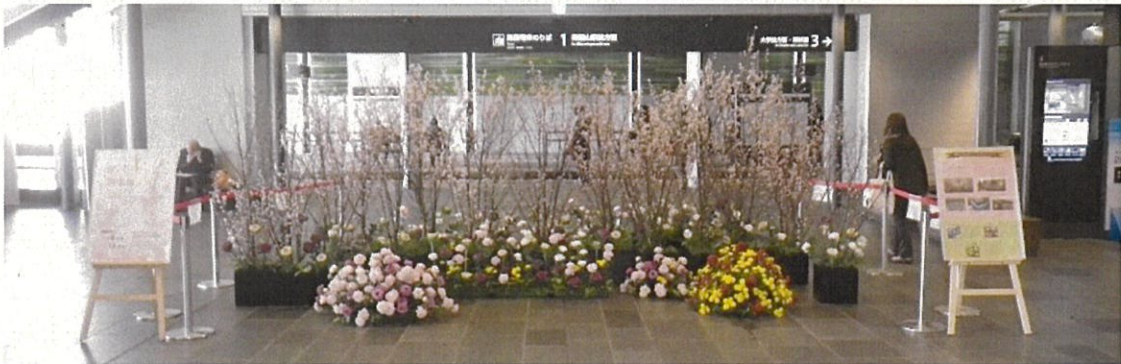
設置イメージ(富山駅南北自由通路:啓翁桜の展示)

季節の花の展示及び販売を行う。また、フラワーアレンジメント教室や写真撮影ポイントの設置など、子どもから大人まで楽しめる場を創出する。