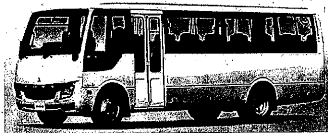
購入車両イメージ