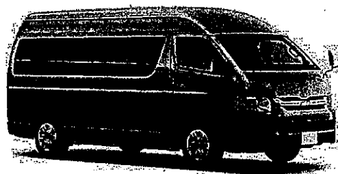
購入車両イメージ