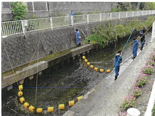
【ごみの回収 (がめ川)】

昨年度は、護岸と網の隙間からごみがすり抜けていくが多かったため、今年度、新たに網を二重に設置する方法への変更や、網の両側にすり抜け防止用フェンスを設置した結果、回収したごみの量の増加につながった。