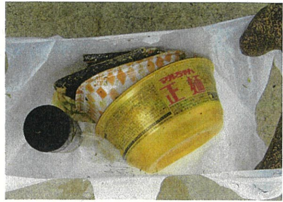
【プラスチックごみ】