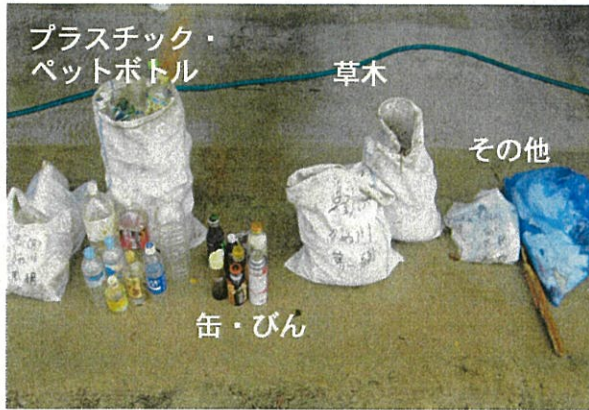
【「がめ川」 8/31 回収分 (3 日分、約 26 kg)】