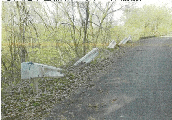
○八尾牛岳線(ガードレール破損)