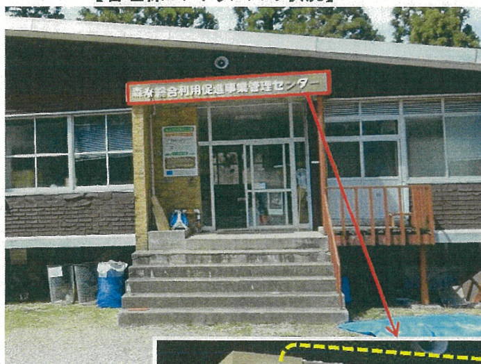
【管理棟エントランスの状況】

今冬の大雪等により、管理棟エントランスの屋根等にずれが生じて、落下する危険性があることから、修繕を実施する。