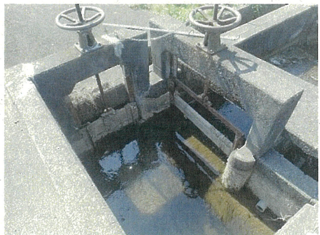
操作が困難となった水門