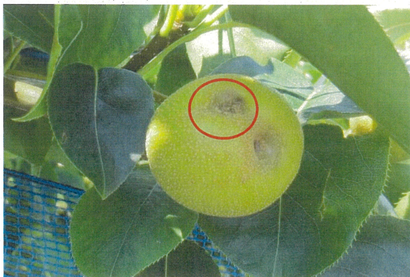
霰により被害を受けた規格外の呉羽梨