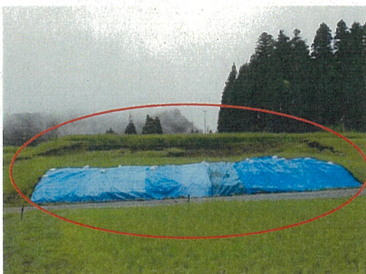
○八尾町布谷地区(田)