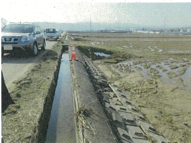
漏水による法面崩壊