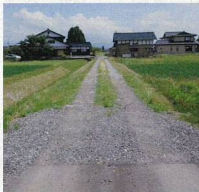
砂利道のアスファルト舗装