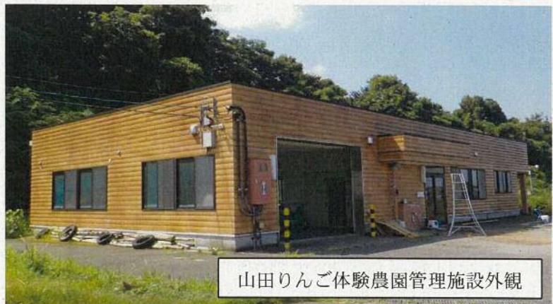
山田りんご体験農園管理施設外観