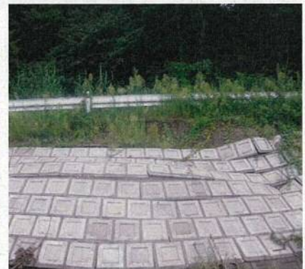
崩壊した法面の原形復旧