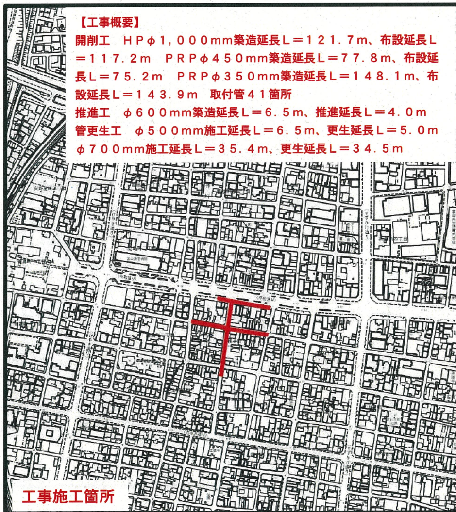
位 置 図