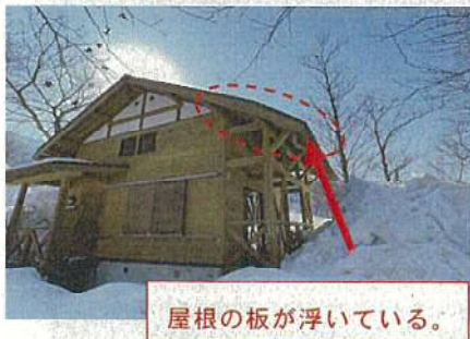
【コテージの屋根の破損状況】