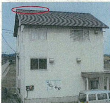
頭首工管理棟屋根破損