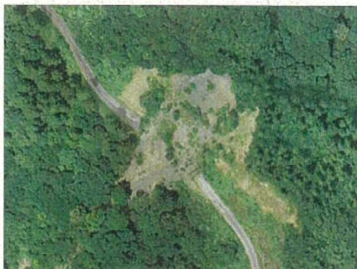
○被災箇所 (上空からの様子)