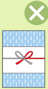
お歳暮・お年賀など