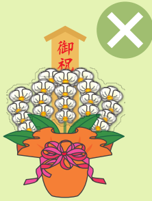
落成式・開店祝などの祝花、 葬儀の供花、病気見舞いなど