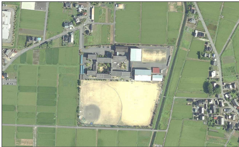
图 4-4 水橋高等学校周辺航空写真