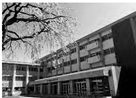
校舎(A棟) 平成30年2月完成