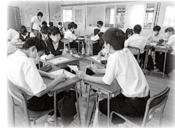
朝の学び合い学習