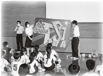
南中プライドプロジェクト 校章旗