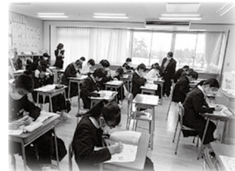
道徳科 授業研修会