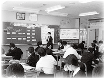
「学び合い」研修会授業