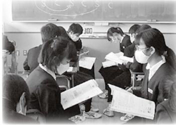
「主体的・対話的で深い学び」