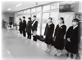
生徒会あい(eye)さつ運動