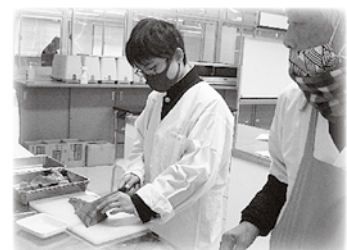
働く人に学ぶ講演会