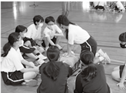
いのちを守る「海の安全教室」