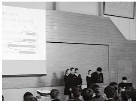
生活を見直す「学校保健委員会」