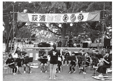
地域に貢献する岩中生