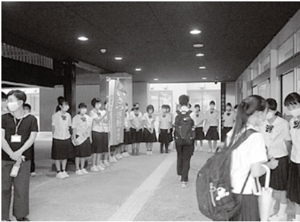
笑顔あふれる「あいさつ運動」