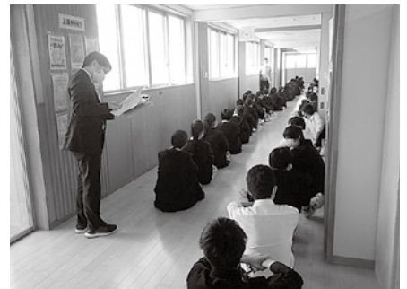
災害に備える「避難訓練」