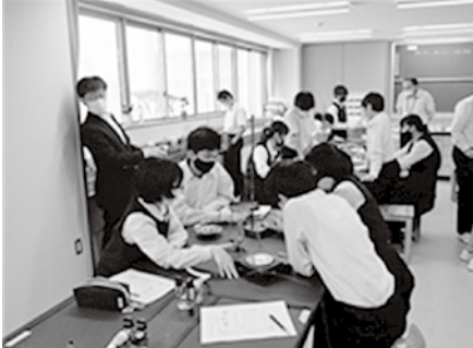
考えを深め合う「学び合い」