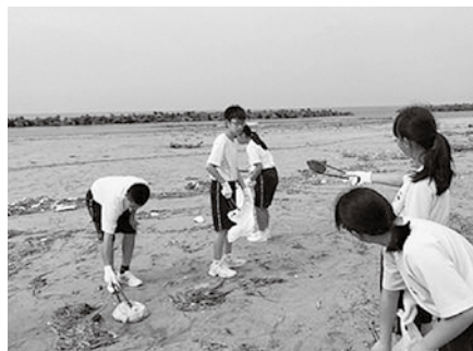
伝統の「岩瀬浜清掃」