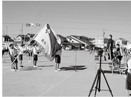
一致団結！体育大会