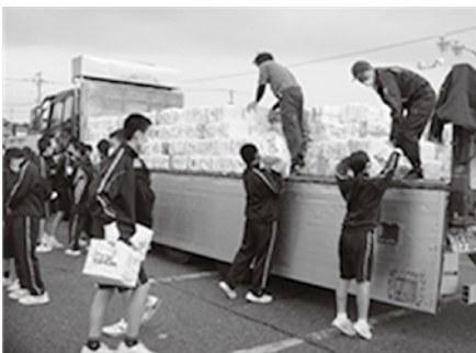
生徒が活躍する「資源回収」