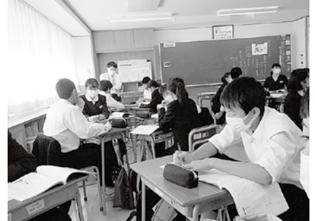
考え対話する道徳