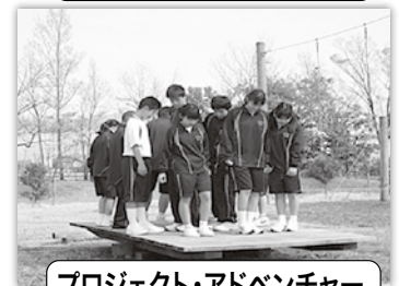
プロジェクト・アドベンチャー