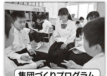
集団づくりプログラム