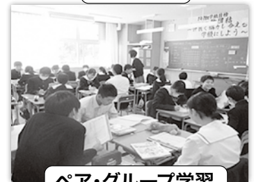
ペア・グループ学習