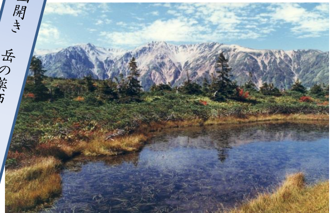
〈薬師見平からの薬師岳圏谷群〉