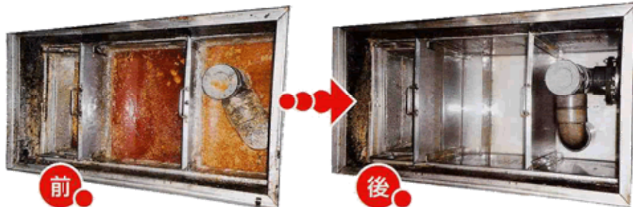
グリース阻集器の洗浄前と洗浄後