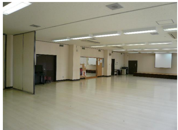
オーディオ機器・器具